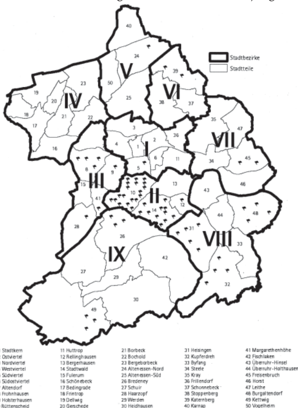
Abb. 2: Masernerkrankungen nach Stadtbezirken; Ausbruch ausgehend von einer Waldorfschule in Essen, 2010 (n=71)

Die hohen Durchimpfungsraten von 92% für die 2. MMR-Impfung bei der Schuleingangsuntersuchung 2009 in Essen sowie bei 11- bis 13-jährigen Schülern lassen hoffen, dass der Ausbruch auf den oben beschriebenen Personenkreis begrenzt bleibt. Der frühzeitige und konsequente Ausschluss nichtimmuner Kinder vom Unterricht der Waldorfschule und anderer Gemeinschaftseinrichtungen sowie die Aufklärung der Bevölkerung haben ebenfalls zur Begrenzung der Viruszirkulation beigetragen.