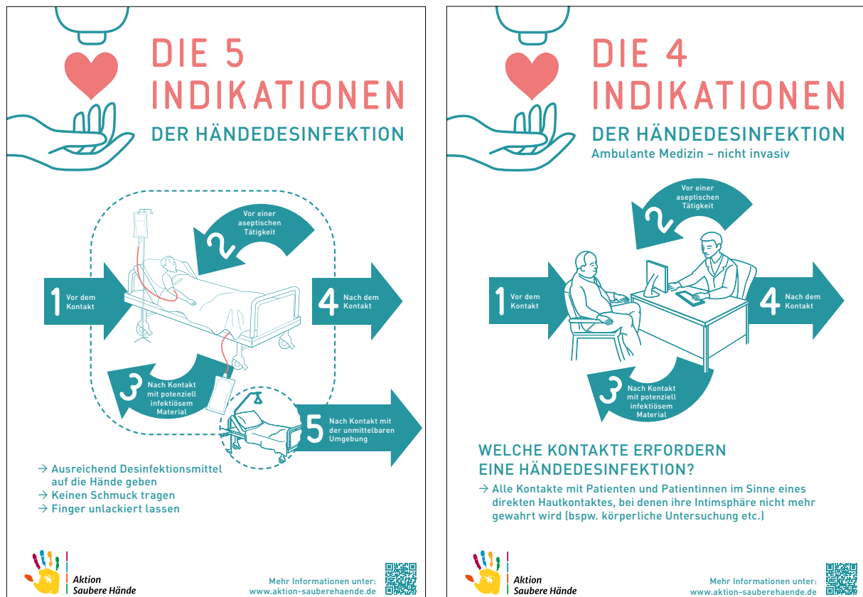
Abb. 1 | Die 5 Momente der Händedesinfektion in der stationären Versorgung (links) und die 4 Momente in der ambulanten Versorgung (rechts)

sind hierbei u. a. Chemikalienbeständigkeit und Produktinformationen des Handschuhs zu beachten (KRINKO 2016). Nach Ablegen der Handschuhe empfehlen KRINKO und TRBA 250 übereinstimmend eine Händedesinfektion, da eine (unbemerkt) Kontamination der Hände, z. B. durch (Mikro-) Perforationen oder beim Ausziehen der Handschuhe, möglich ist. Die Verwendung von medizinischen Einmalhandschuhen steigert somit potenziell sogar die Anzahl der notwendigen hygienischen Händedesinfektionen.